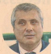
Paolo Ielo. Procuratore aggiunto di Roma e responsabile pool reati contro la Pa

«È un reato in cui ci sono tanti input ma pochi output: ci arrivano diverse denunce ma è molto difficile da dimostrare sia sul versante della condotta che sul versante del dolo», spiega il procuratore aggiunto di Roma Paolo Ielo, responsabile del pool dei reati contro la pubblica amministrazione. Il rischio, infatti, è che chiunque rilevi una illegittimità in un atto dell'amministrazione possa ritenere esistente un abuso d'ufficio, con conseguente denuncia. Il risultato è