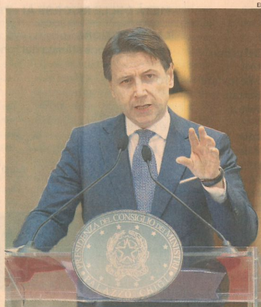
Il premier. Tra le misure per la ripresa, Giuseppe Conte ha annunciato di voler riformare il reato di abuso d'ufficio

Un'indagine svolta lo scorso anno sui dipendenti della Regione Campania e coordinata dall'Università di Salerno conferma la paura di agire del dipendente pubblico, con il 65% degli intervistati che dichiara di sentirsi condizionato nell'attività dal timore di essere sottoposto a un procedimento per abuso d'ufficio (si veda il questionario sotto).