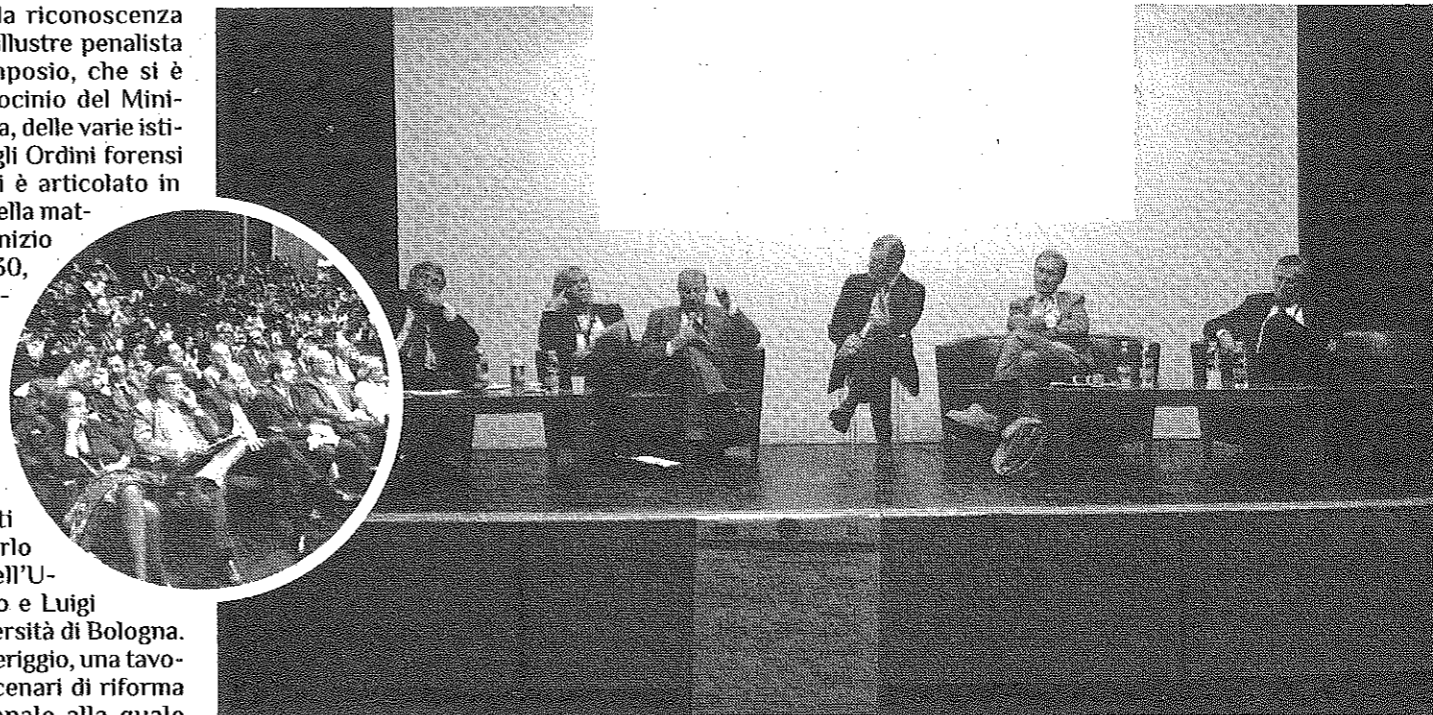
INCONTRO ALL'UNIVERSITA' Il Procuratore Capo presso il Tribunale di Salerno, al convegno Crisi e riforma del sistema penale

■ Monito ai colleghi della Procura «Ci vuole dignità per fare il pm»